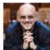
Enrico Ruggeri è tra gli ospiti del "Record store day" al Dal Verme

La giornata dei dischi chicche e ospiti illustri