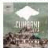
La locandina di "Climbam", primo festival dell'arrampicata all'Oca

I segreti dell'arrampicata nel primo festival all'Oca